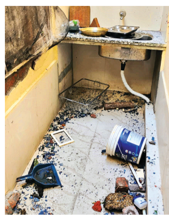
हरिभूमि न्यूज़ ▶▶ ब्यावरा

शहर के शिवधाम कॉलोनी में शुक्रवार सुबह गैस लिकेज से हुए धमाके में एक रिटायर्ड इंजीनियर की मौत हो गई। वहीं उनकी पत्नी गंभीर रूप से झुलस गईं जिनका अस्पताल में उपचार जारी है। यह घटना सुबह करीब 6 बजे चूल्हा जलाने की कोशिश के दौरान हुई। प्रारंभिक जानकारी के अनुसार घर में