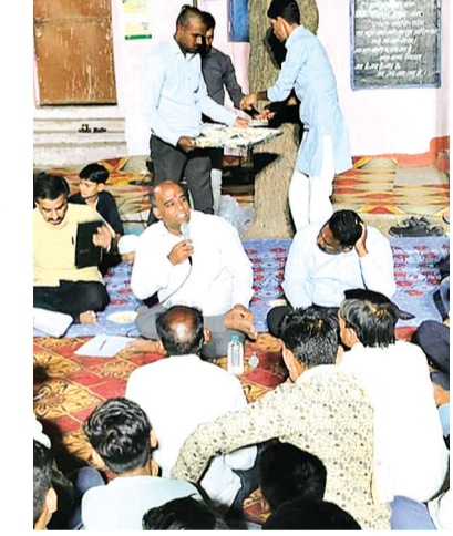
हरिभूमि न्यूज़ ▶▶ राजगढ़