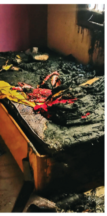
हरिभूमि न्यूज़ ▶▶ ब्यावरा

पिछले 13 वर्षों से ब्यावरा में रह रहा था। उनकी कोई संतान नहीं थी और वे इस मकान में अकेले ही रहते थे। देहात थाना पुलिस के एएसआई गंगा प्रसाद साहू ने मामले में मर्ग कायम कर जांच शुरू कर दी है। उन्होंने बताया कि शुरुआती जांच में हादसे की वजह गैस लीकेज मानी जा रही है, हालांकि तकनीकी पहलुओं की भी जांच की जा रही है। पोस्टमार्टम के बाद शव