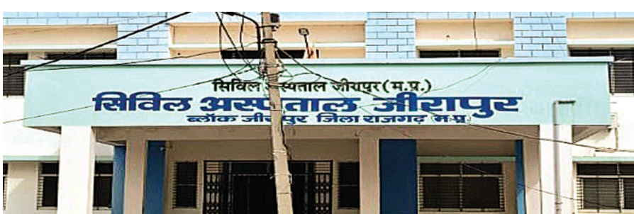
हरिभूमि न्यूज़ ▶▶ राजगढ़